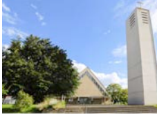
St. Michael Neuffen