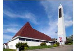
Heilig Geist Großbettlingen