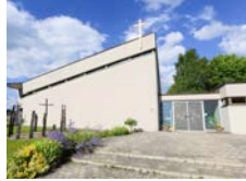
St. Paulus Beuren