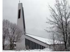
Klaus v. Flüe Frickenhausen